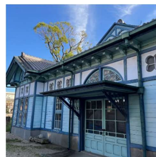
旧額田郡物産陳列所

江戸時代初期より豆味噌を造り続ける老舗のひとつ「まるや」の事務所棟。旧東海道の町家の意匠を残す。第 6 号岡崎市景観重要建造物。