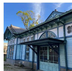
旧額田郡物産陳列所