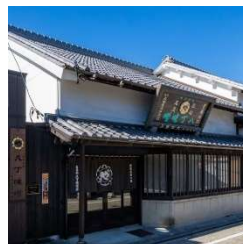
(株)まるや八丁味噌事務所棟