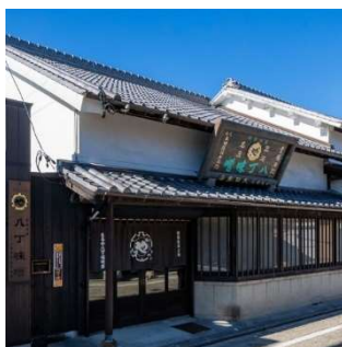
株まるや八丁味噌事務所棟

岡崎城旧本丸に位置し、諸願成就や開運守護のお社として信仰される神社。祭神は徳川家康公、本多忠勝朝臣、天神地祇、護国英霊。