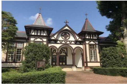
きゅういばら きけんりつつちうらちゅうがっこうほんかん 【土浦市】旧 茨城県立土浦中学校本館