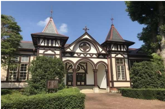
きゅういばら き けんりつ つちうら ちゅうが っこうほんかん 旧茨城県立土浦中学校本館

本計画では、市内に残る歴史的な建造物の保存・活用に関する事業や、歴史や伝統文化を反映した活動の承継に関する事業、歴史的風致を活用した交流人口の拡大に関する事業、歴史的な建造物等の周遊環境の整備に関する事業等を位置づけ、歴史的風致の維持及び向上を図っていくこととしています。