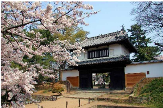
つちうらじょうし きじょうこうえん 土浦城址(亀城公園)