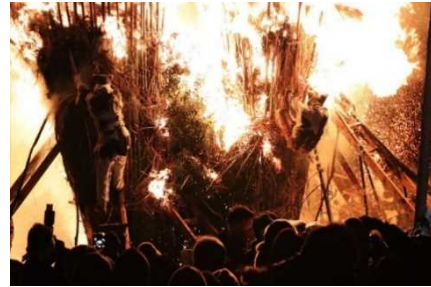
とば 【西尾市】鳥羽の火祭り