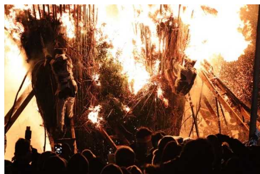
とば 鳥羽の火祭り