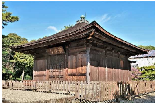
じっそうじしゃかどう 実相寺釈迦堂