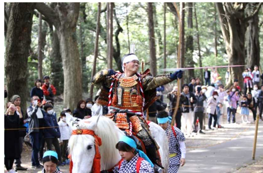
ひえしんしゃやぶさめまつり 日枝神社流鏝馬祭