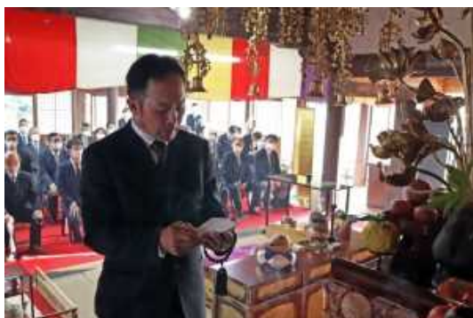
ちゃそほうこくさい 茶祖奉告祭