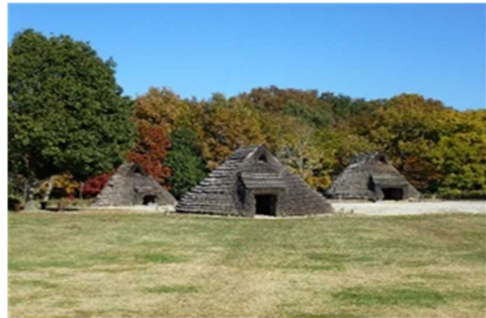
かみたか つ かいづか 上高津貝塚