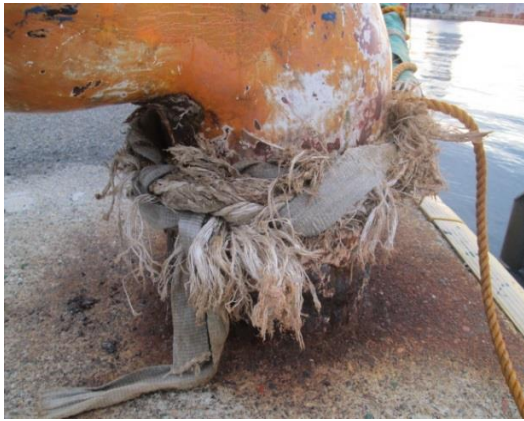
写真7：劣悪な係留ロープ