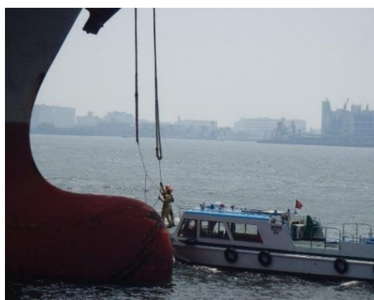
写真1：本船よりロープを受け取る繫船ポート（東京港）

一方、何らかの要因により繫留ロープが切断し、作業員に接触すると人命にも関わる可能性があります。