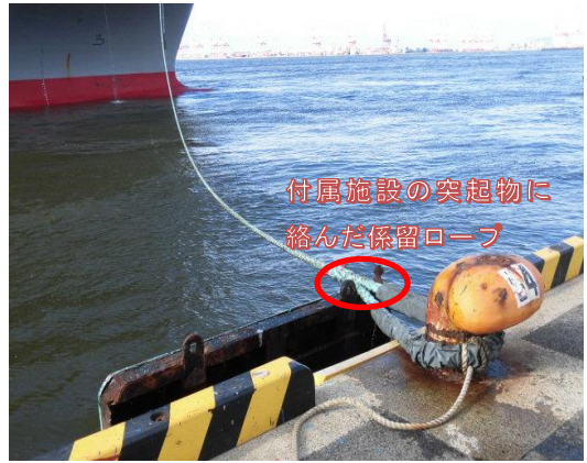
写真8：付属施設に絡んだ係留ロープ