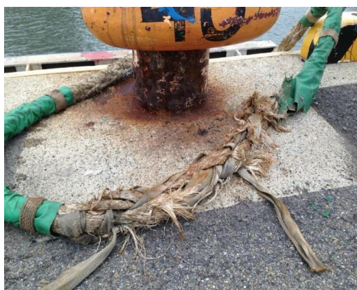
写真6：劣悪な係留ロープ