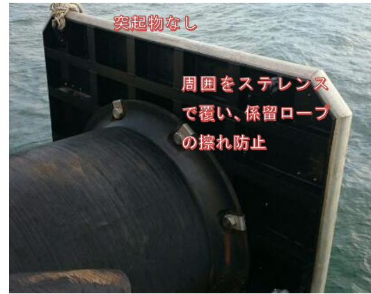
写真10：係留ロープが絡みにくい対策