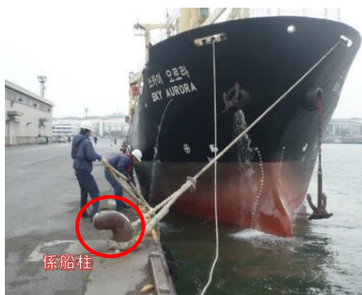
写真2：係船柱にロープをかける作業（名古屋港）