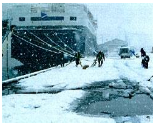
写真5：吹雪の中での繫船作業（伏木富山港）