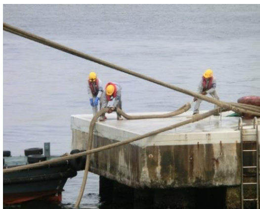
写真3：係船柱にロープをかける作業（神戸港）