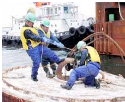
写真4：不安定な足場での繫船作業（函館港）