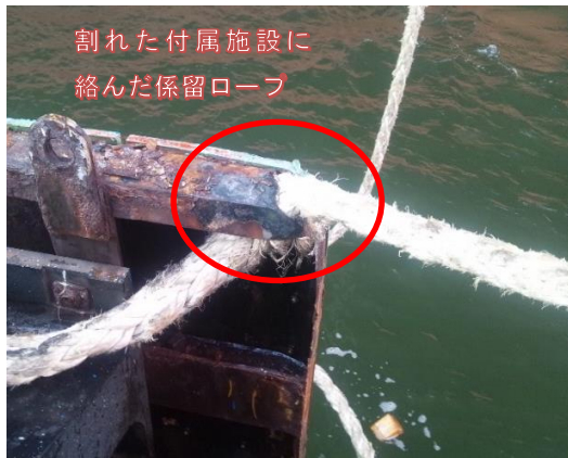
写真9：付属施設に絡んだ係留ロープ