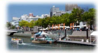
親水護岸の利用 (新町川/徳島市)