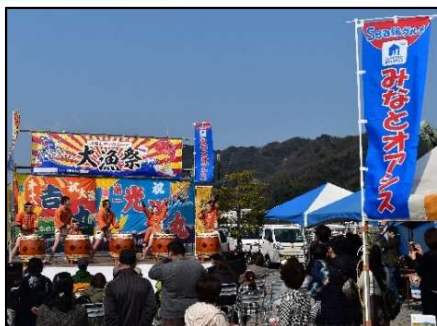
地域振興イベントの開催状況