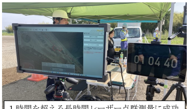
1時間を超える長時間レーザー一点群測量に成功