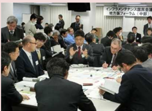
メンテナンスの課題を解決する技術等の紹介や技術マッチング