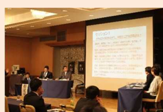
技術者の確保や育成に関する各地での取組み紹介