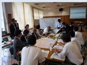
個別施設計画の策定・実施の課題解決につながるアイデア紹介