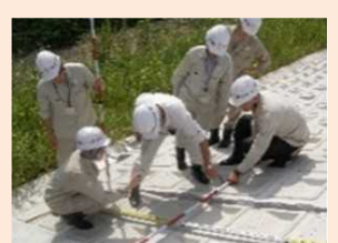
地域における技術者派遣の仕組みづくりの支援