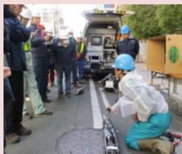
新技術の導入検討のための現場試行の調整