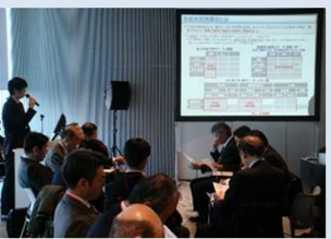
包括的民間委託等の民間活用取組み事例の紹介