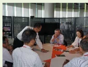
地域が主体となったメンテナンス活動の紹介