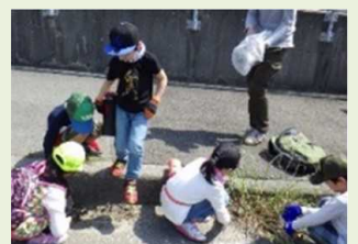
地域一体の取り組みへのサポート