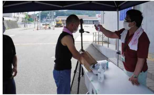
避難所受け入れ訓練(消毒、検温、受付)