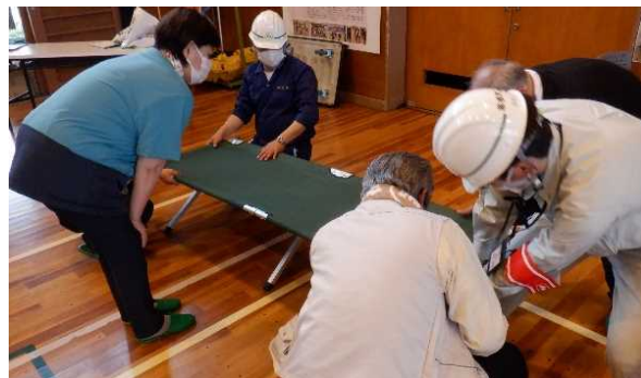
避難所設置訓練(簡易ベッド等)