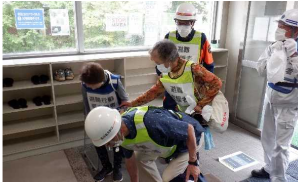
要支援者の避難支援訓練