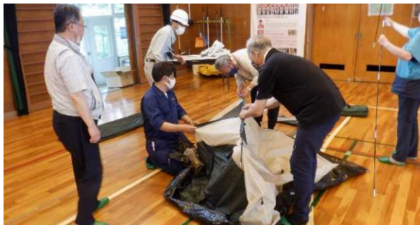
避難所設置訓練(テント組立)