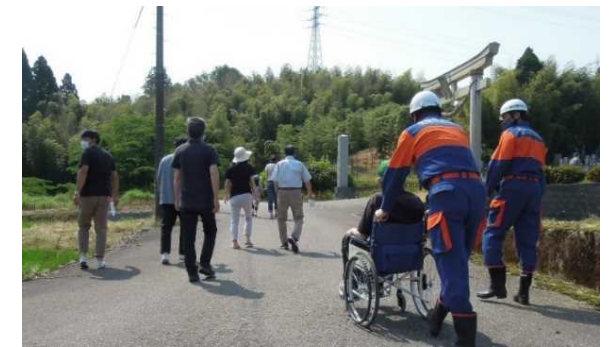
住民避難訓練(消防団による避難支援)