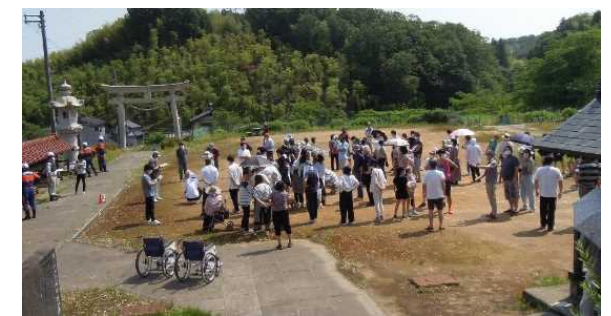
一時避難場所(集合場所)での人員確認