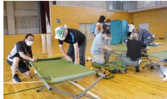
避難所設置訓練(簡易ベッド等)