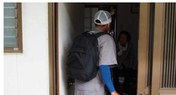
声掛け等による避難支援活動訓練