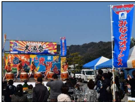
地域振興イベントの開催状況