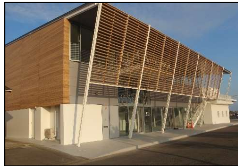
構成施設のイメージ