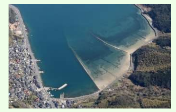
浚渫土砂を活用した干潟の造成(徳山下松港)