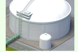
水素受入基地の整備(大型液化水素貯蔵タンク)