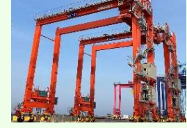
低炭素型荷役機械の導入(神戸港)