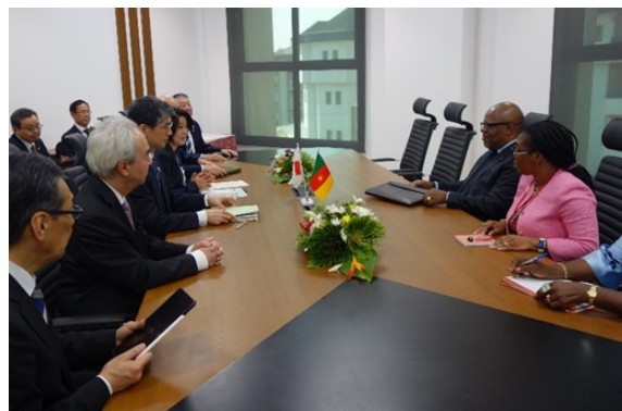
天野海外プロジェクト審議官とンジュカン経済・計画副大臣のバイ会談