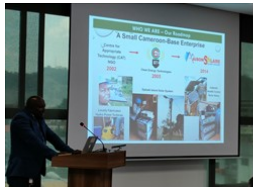
ンディキラーSolarHouse 社 CEO 発表