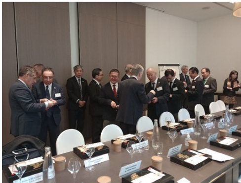
FNTP メンバーと JAIDA メンバーの名刺交換