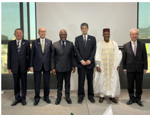
官民インフラ会議フォトセッション