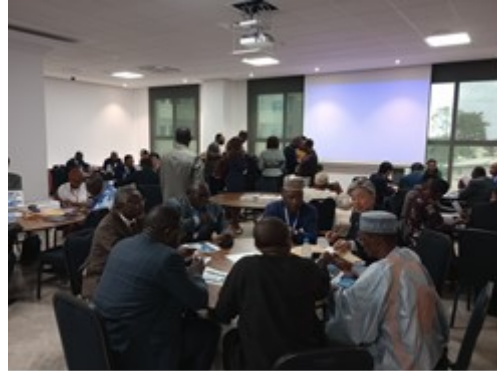
ビジネスマッチングの様子