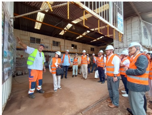
ラゼル・ヤウンデのベースキャンプで視察する国交省及び JAIDA メンバー