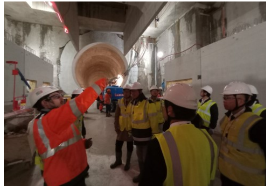
グラン・パリ・エクスプレスの建設現場を視察する国交省及び JAIDA メンバー