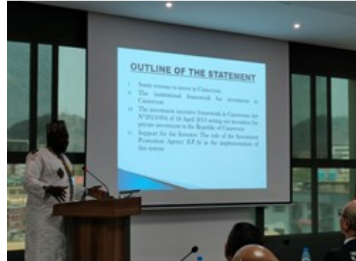
バーラ投資促進庁次長基調講演