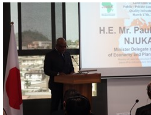
ンジュカン経済・計画副大臣開会挨拶