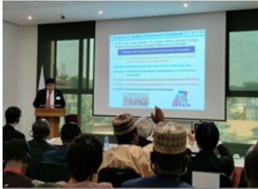
太田国際建設産業戦略官基調講演