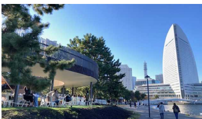
賑わい交流拠点の整備