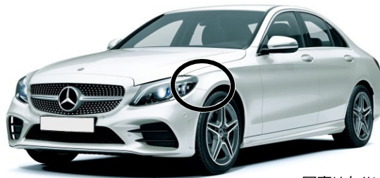
写真は左ハンドル仕様車