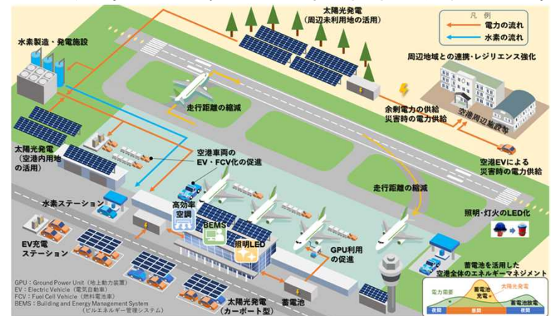
空港の脱炭素化推進のイメージ

全体計画が3ヶ年以上の場合、3年目以降もわかるよう資料を作成。令和7年度以降は、本募集での審査の結果に関わらず改めて応募。