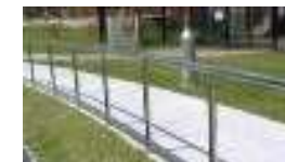
プロムナード整備