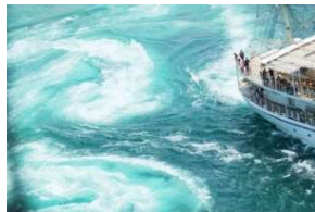
トライアルツアーの実施

(例:トライアルツアーの実施、二次交通のトライアル実施、イベントの企画・運営、多言語やICTを活用した情報発信、モニターツアーの実施 等)