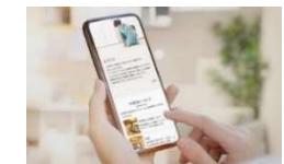
観光案内システム

※磨き上げを実施した観光コンテンツに関するもの (本補助金の活用等により並行して実施するものを含む)に限る