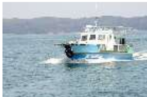
二次交通のトライアル実証