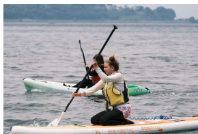
モニターツアーの実施