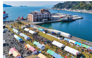
イベントの企画・運営