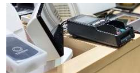
キャッシュレス対応