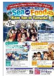
多言語情報パンフレット