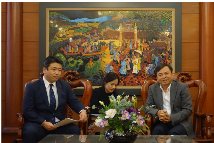
会談の様子（左：西田国土交通大臣政務官、ヒエップ農業農村開発副大臣）

令和4年12月21日、ベトナム農業農村開発省にて、西田国土交通大臣政務官とヒエップ農業農村開発副大臣は、水防災分野について意見交換を行うとともに、今後も両省間の協力を進めていくことで一致しました。