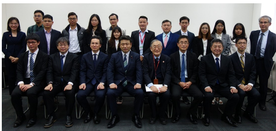
記念写真（下段中央左：西田国土交通大臣政務官、中央右：古田日越大学学長）