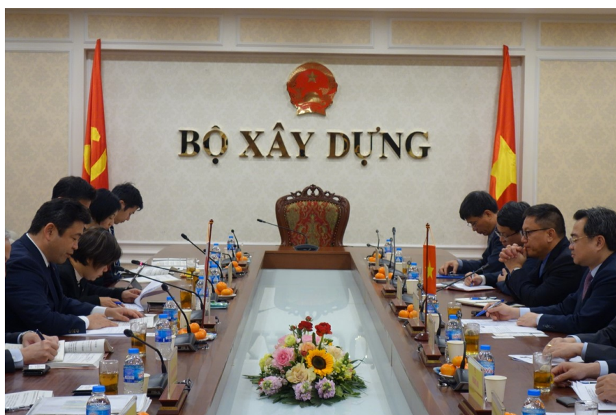
会談の様子（左：西田国土交通大臣政務官、右：ギ建設大臣）

令和4年12月21日、ベトナム建設省にて、西田国土交通大臣政務官とギ建設大臣は、下水道、スマートシティ、不動産等での協力について、意見交換を行い、今後も両省間のさらなる連携を進めていくことで一致しました。