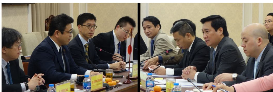
会合の様子(左:西田国土交通大臣政務官、右:ヴァン建設副大臣)

「建設マネジメント」「下水道」「スマートシティ」、また「日・ベトナム建設会議」に関して、意見交換を行い、日本側より日本の事例等について紹介し、ベトナム側よりベトナムの建設分野における課題等について発表がされました。