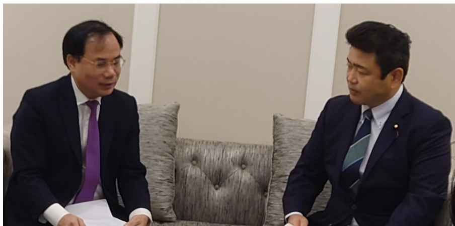
会談の様子（左：シン建設副大臣、右：西田国土交通大臣政務官）

令和4年12月20日、ハノイ市内の会場（ホテル）にて、西田国土交通大臣政務官とシン建設副大臣は、建設・不動産分野での協力について、意見交換を行いました。