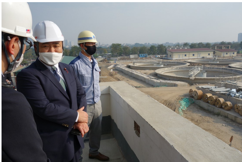
建設工事を受注している日本企業等から概要説明を受ける西田政務官

令和4年12月21日、西田国土交通大臣政務官はハノイ市エンサ下水処理場（建設中）を訪問し、工事を受注している日本企業等より概要説明を受け、建設中の工事現場の視察を行いました。