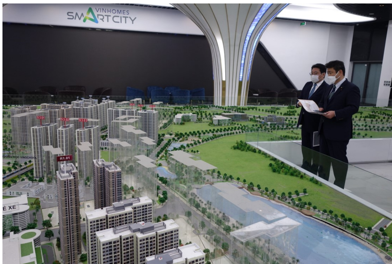
ビンホームズ・スマートシティの概要説明を受ける西田政務官

令和4年12月20日、西田国土交通大臣政務官はビンホームズ・スマートシティを訪問し、日本企業が参画するThe Sakuraプロジェクトについて、指紋認証システムや和風庭園の設置等、日本の強みを活かしたまちづくりの概要説明を受け、モデルルームなどの視察を行いました。