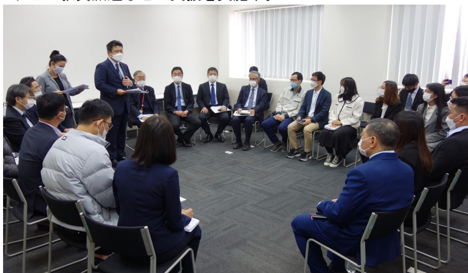
社会基盤分野の教員・学生との意見交換の様子

※2016年9月に開校されたベトナム国立大学のグループ校の一つ。2015年よりJICAによる技術協力プロジェクトで教員派遣などの支援を実施中。