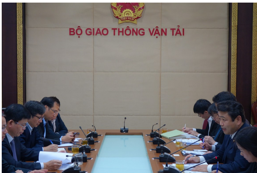
会談の様子（左から2人目：トゥアン運輸副大臣、右：西田国土交通大臣政務官）

令和4年12月21日、ベトナム運輸省にて、西田国土交通大臣政務官とトゥアン運輸副大臣は、交通分野における両省間の協力について意見交換するとともに、ベトナムにおけるインフラの円借款事業について、適切かつ円滑な事業実施のための環境整備が成されるよう働きかけを行いました。