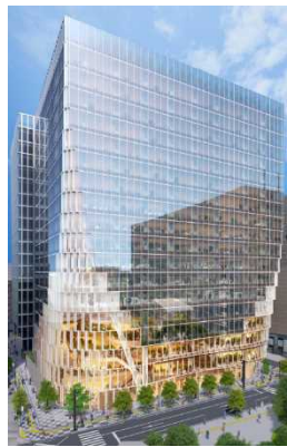
（仮称）天神ビジネスセンター2期プロジェクト