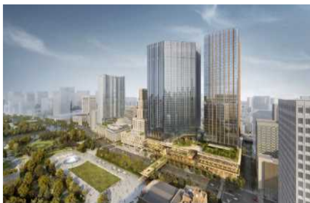
内幸町一丁目街区完成イメージ