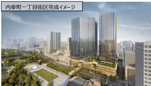
内幸町一丁目街区完成イメージ