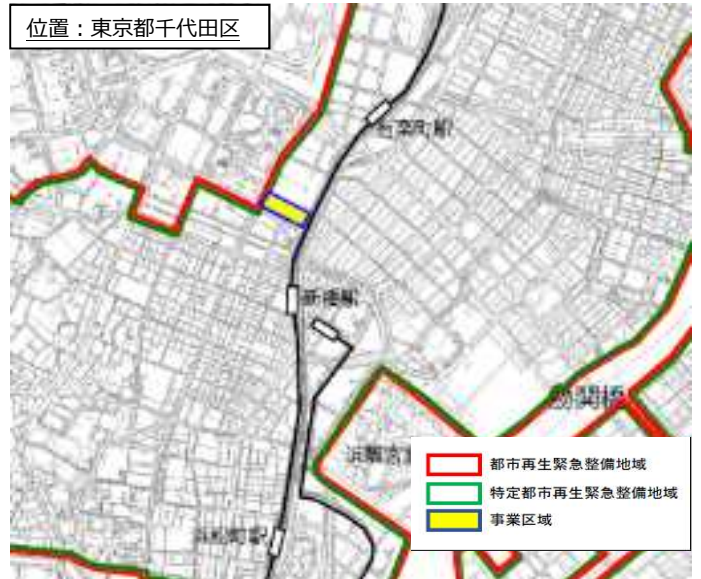
位置：東京都千代田区