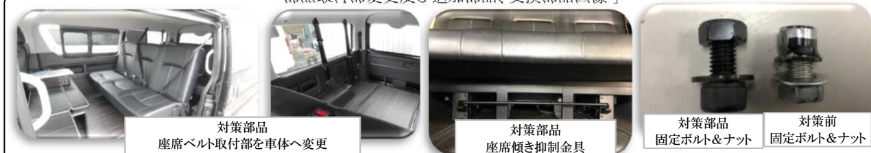
対策部品 座席ベルト取付部を車体へ変更