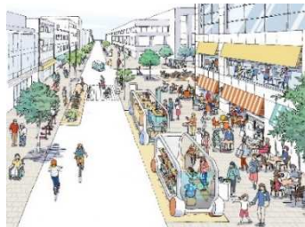
曜日や時間帯に応じて 道路空間の使い方が変わる 路側マネジメント