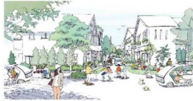
安全性や快適性が確保された 歩車共存の生活道路