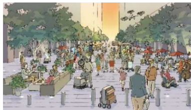
人中心の空間として再生した まちのメインストリート