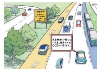
電気自動車や燃料電池車のための 非接触給電レーンや水素ステーション