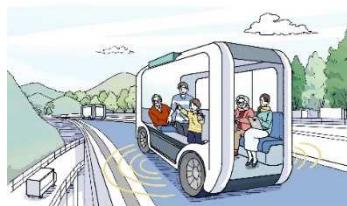
幹線道路ネットワークに設置された 自動運転車の専用道