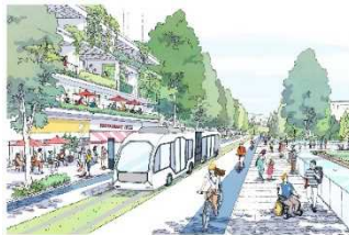
BRTや自転車等を中心とした 低炭素な交通システム