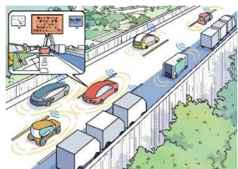
道路インフラがコネクテッドカーを 最適経路に案内