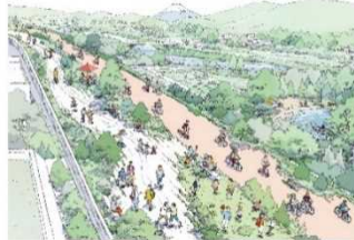
公園のような道路