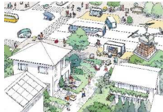
ロボット配送により ラストマイル輸送を自動化・省力化