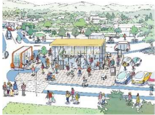
様々な交通モードの接続・乗換拠点 (モビリティ・ハブ)