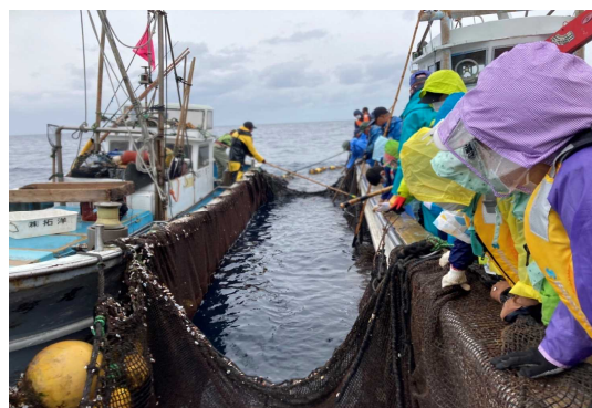
定置網の網もち体験（甌島）