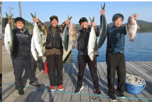
海洋クラブの部活動（隠岐の島）