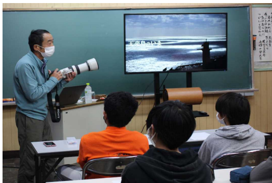
ふるさと学習の様子（天売島）