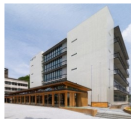
木質耐火部材を用いた大規模庁舎

《実績》 合計115件（H22～26年度までの前身事業の実績を含む。取下げ分を除く） (近年の年度別) H27:5件、H28:20件、H29:9件、H30:11件、R1:8件、R2:12件、R3:11件