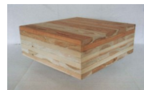
CLT（直交集成板）パネル