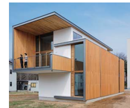
CLT工法による実験棟