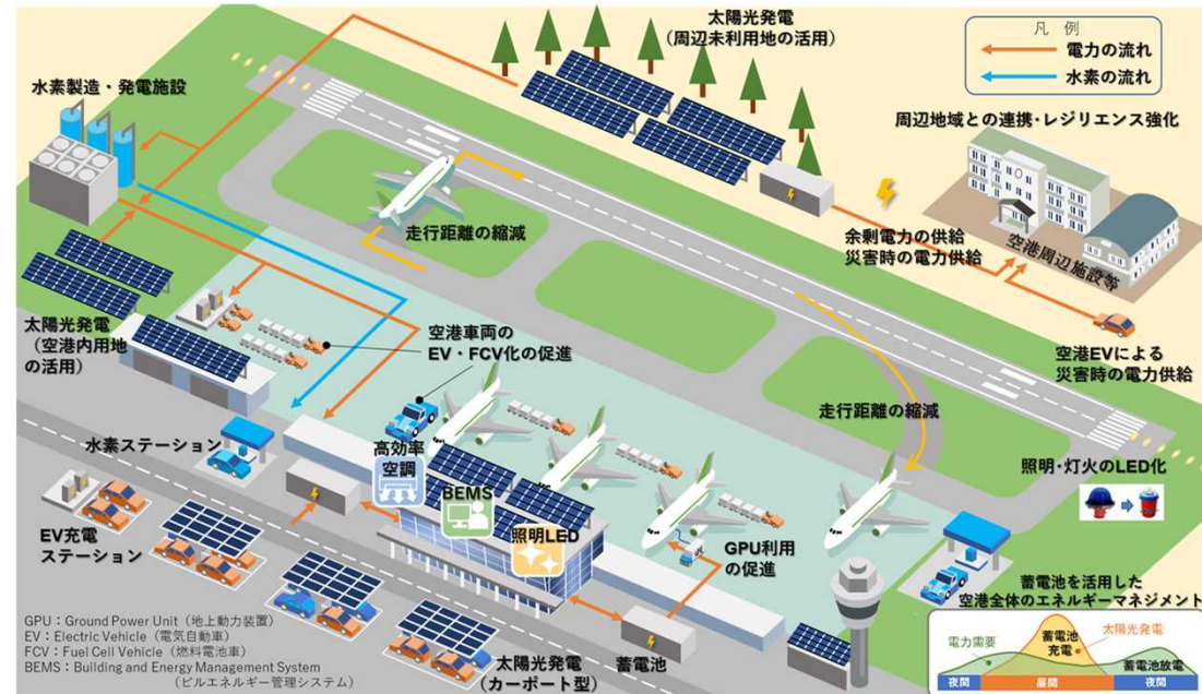
空港の脱炭素化推進のイメージ