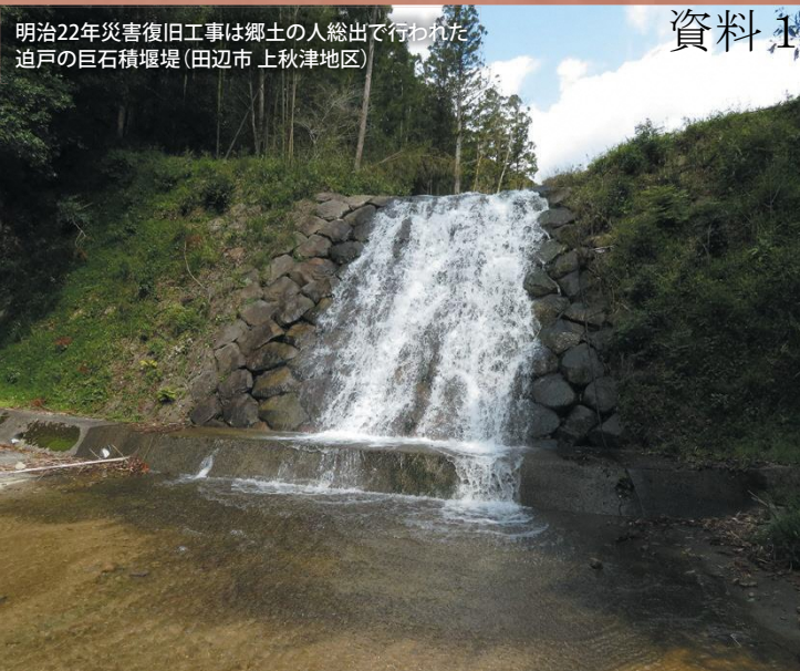
明治22年災害復旧工事は郷土の人総出で行われた 追戸の巨石積堰堤(田辺市 上秋津地区)