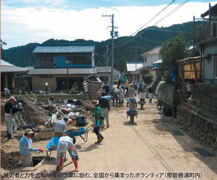
被災者と力を合わせ復旧作業に励む、全国から集まったボランティア(那智勝浦町内)