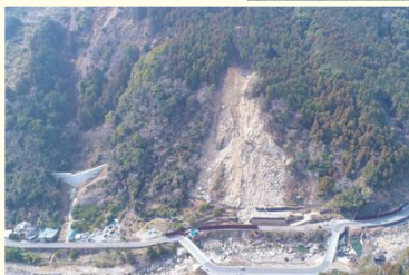
紀伊田辺地区民有林直轄治山事業