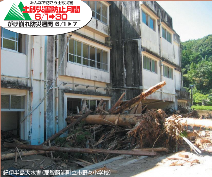
紀伊半島大水害(那智勝浦町立市野々小学校)