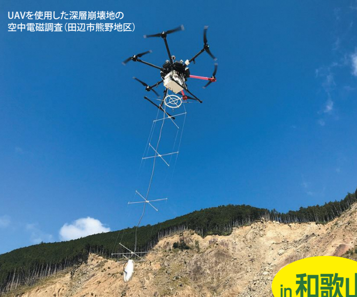
UAVを使用した深層崩壊地の 空中電磁調査(田辺市熊野地区)