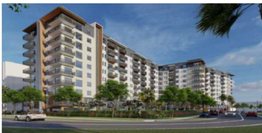
フロリダ州タンパ