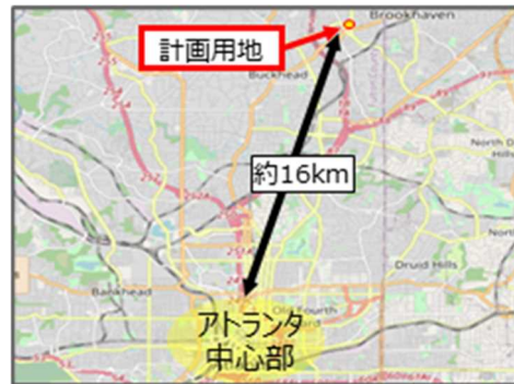
ジョージア州アトランタ