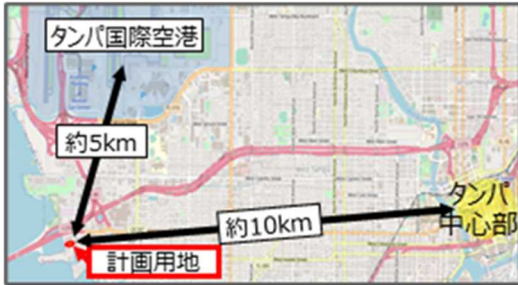
フロリダ州タンパ