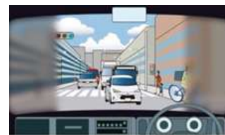
歩行者や自転車が見えていない