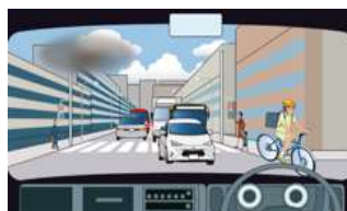
信号が見えていない