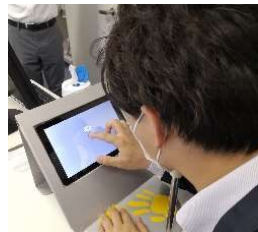
タブレット型視野計