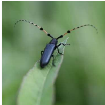
フサヒゲルリカミキリ