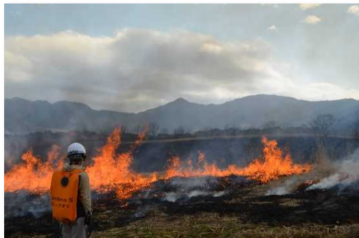
山焼き（火入れ）の様子