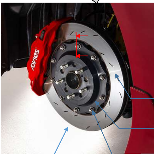
フロントブレーキローター