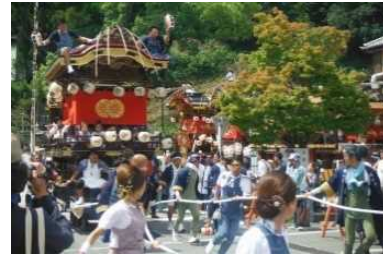
ふたまた 二俣まつり