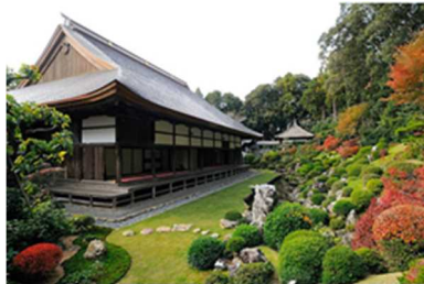
りょうたんじていえん 龍潭寺庭園

なお、今回の認定により、認定都市数は39府県87市町となりました。（詳細は別紙参照）