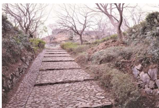
と ばやまじょうあと 鳥羽山城跡