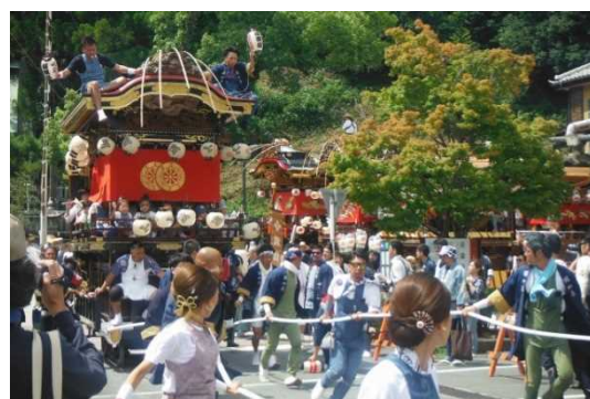
ふたまた 二俣まつり