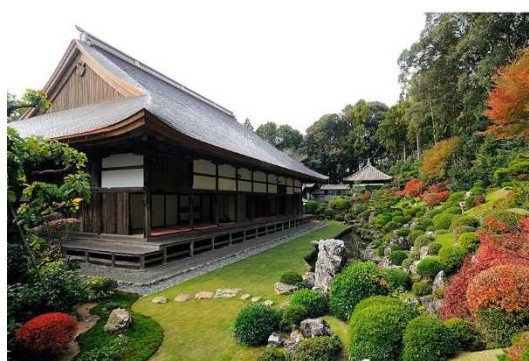
りょうたん じていえん 龍潭寺庭園