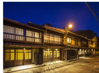
ホテル等に改修された歴史的建造物