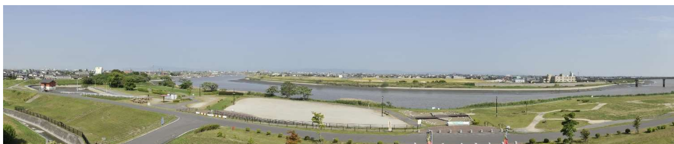
史跡三重津海軍所跡全景

第2期計画では、史跡三重津海軍所跡の遺構を恒久的に保護しつつ、来訪者の理解をより一層深めてもらうための史跡整備事業をはじめ、歴史的建造物の保存・活用、歴史資産等の周遊環境整備、地域固有の歴史文化の継承と市民の理解促進に、引き続き取り組みます。