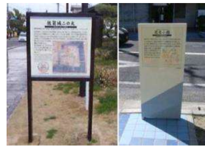
案内・説明看板等の整備