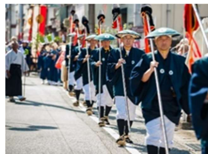
八幡神社の「御神幸行列」

第2期計画では、引き続き城山公園内の石垣保存改修事業を実施するとともに、「御神幸行列」の巡幸路周辺に残る歴史的風致形成建造物保存対策事業、無電柱化事業及び動線環境整備事業等を推進します。