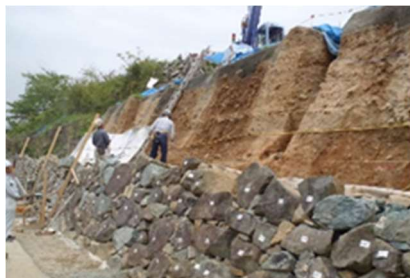
伝統工法による石垣保存改修