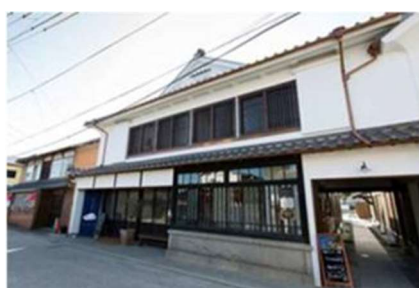
旧久富家住宅取得・保存改修