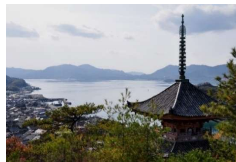
向上寺三重塔(国宝)と瀬戸内海