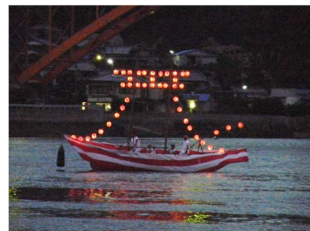
瀬戸田水道で行われる ホーランエンヤ