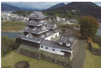
国指定の重要文化財「大洲城」