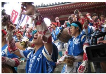
【尾道市】浄土寺の吉和太鼓おどり

尾道市、大洲市、佐賀市の歴史まちづくり計画（第2期）について、歴史まちづくり法に基づき、3月22日付けで主務大臣（文部科学大臣、農林水産大臣、国土交通大臣）が認定しました。