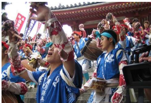
浄土寺の石段を後ろ向きで 登る吉和太鼓おどり

第2期計画では、引き続き、文化財の保存修理等を実施するほか、道路の美装化や建造物の修景整備等の周辺環境整備により、歴史、文化、景観を礎とした歴史的風致の維持向上を図るとともに、文化財以外の歴史的建造物の積極的な保存と活用、ICTを活用した伝統文化・観光情報の発信に取り組み、市民の郷土愛の醸成と国内外に向けてまちの魅力を発信します。