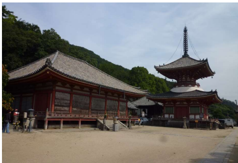
浄土寺阿弥陀堂(左側・重要文化財)と 多宝塔(右側・国宝)