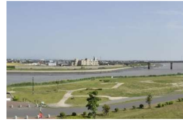
【佐賀市】史跡三重津海軍所跡

今回の認定により、歴史まちづくり計画に取り組む86都市のうち、第1期計画を完了し、第2期計画の取組を進める都市は30都市となります。（各認定都市の詳細は別紙参照）