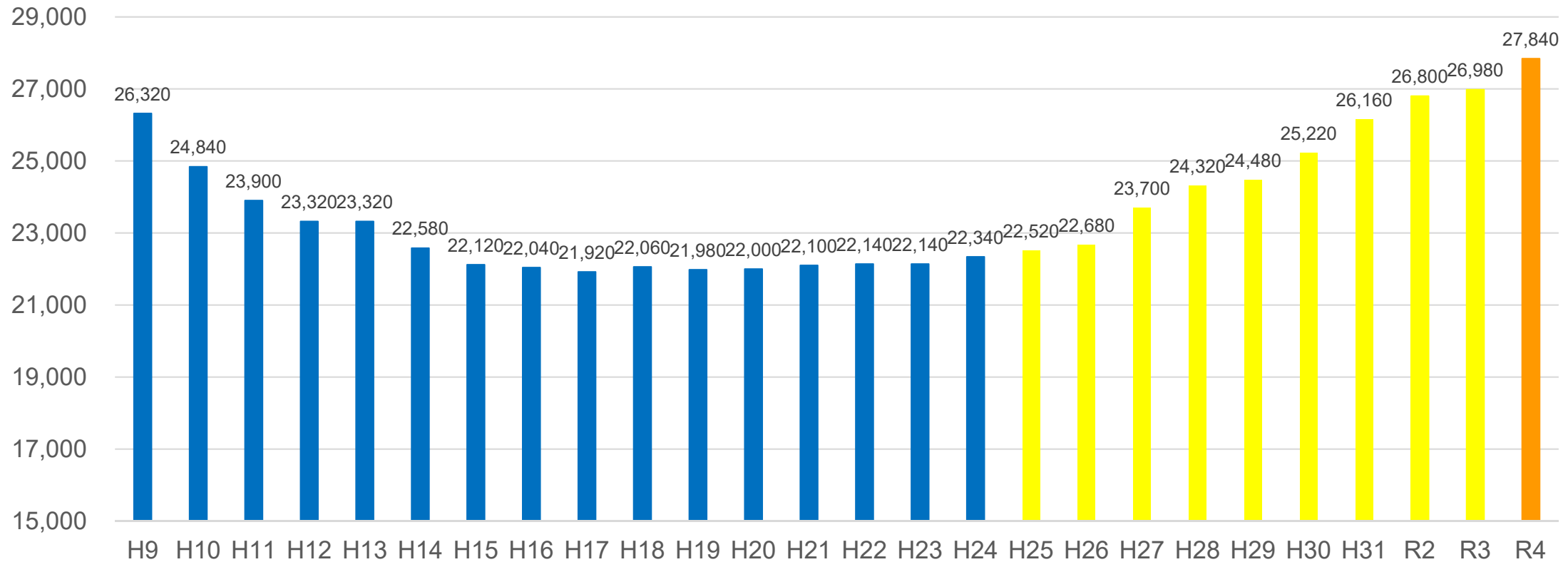
電気通信関係技術者等単価 全職種単純平均値の推移

➡ 全職種平均 27,840円 令和3年3月比 +3.2% (平成24年度比 +24.6%)