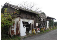
建築物のイメージ