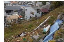
高台から瓦礫や岩石、柵等が落下するおそれ