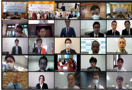
技術セミナーの様子