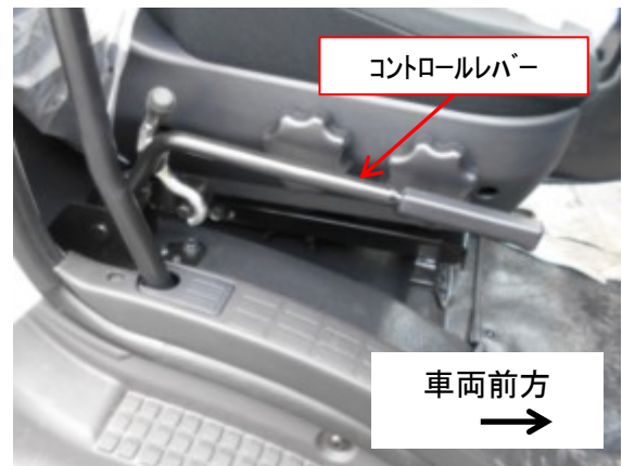
キャブ内コントロールレバー(運転席側)