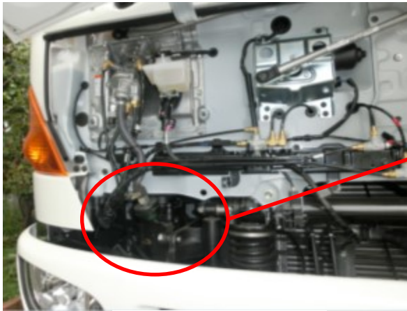
フロントパネル裏