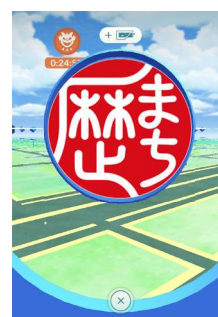
歴まちロゴマーク ポケストップ