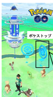
歴史的建造物を紹介するポケストップ ※イメージ

※歴まち認定都市とは、地域固有の風情や情緒を維持向上するために歴史まちづくりに取り組んでいる都市であり、歴史まちづくり法に基づく歴史的風致維持向上計画について国の認定を受けた都市です。