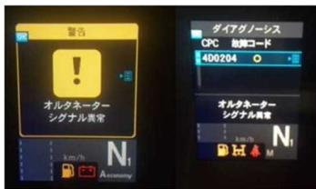
オルタネータ警告表示