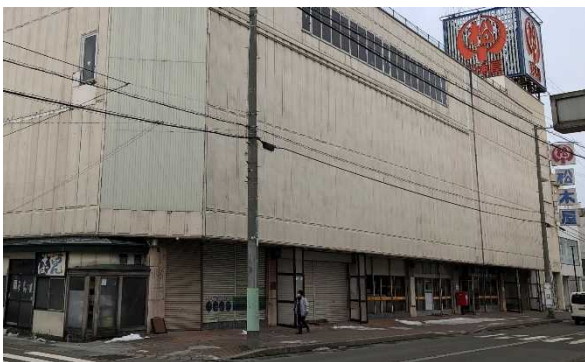
改修前（スーパーさとちょうむつ松木屋店）