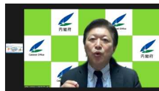
内閣府・高原審議官 発表