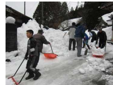
除雪ボランティアによる除雪活動