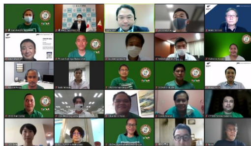
ミーティングの様子

来年3月末までの期間で、ダバオにおける自動交通管制システム改善について調査を実施する。