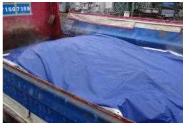
<輸送時の保温技術イメージ>