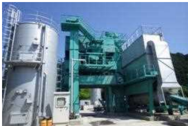
<常温または中温化による製造イメージ>