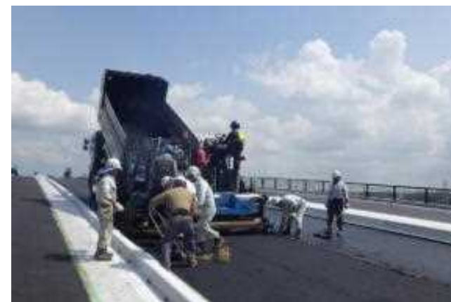
<再加熱等の施工技術イメージ>