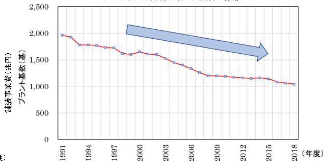
アスファルト合材プラント基数の推移