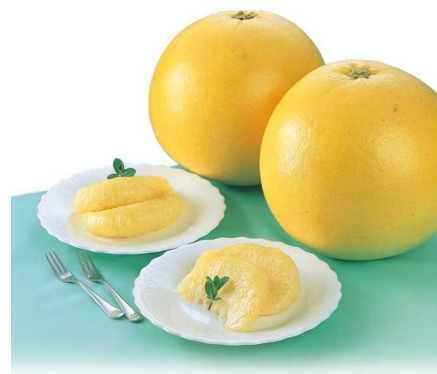
晩白柚 (ばんぺいゆ)

熊本県で栽培されているいぐさは全国の約9割を占め、そのほとんどが八代地域で栽培されています。