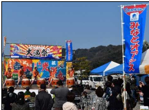
地域振興イベントの開催状況