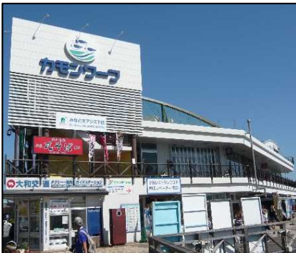
構成施設のイメージ