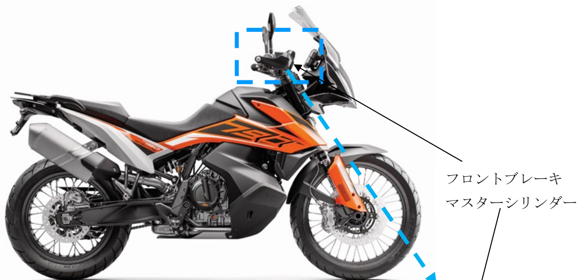
フロントブレーキ マスターシリンダー