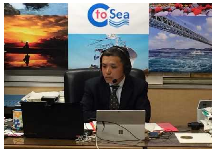
昨年11月開催の海洋環境保護委員会の様子 ( オンライン形式 )