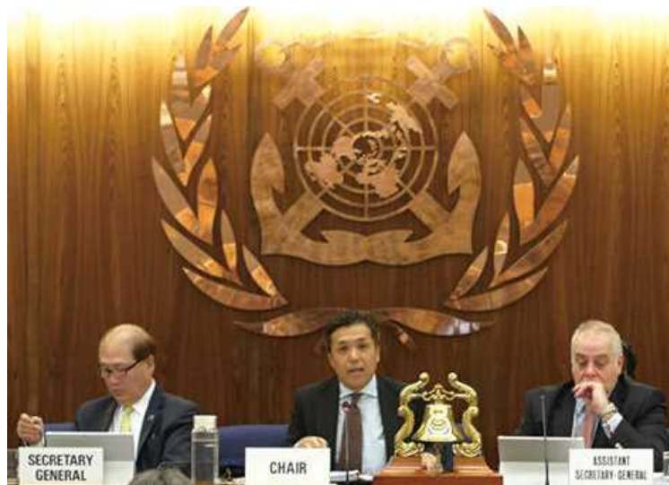
過去の海洋環境保護委員会の様子 (IMO本部(ロンドン))