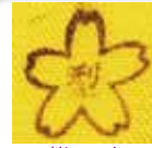
桜マーク （記載場所や内容については、販売者に確認してください。）