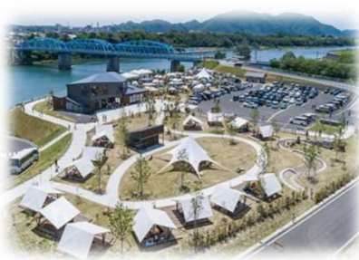
賑わい拠点の整備 (木曾川 / 美濃加茂市)