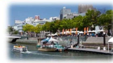
親水護岸の利用 (新町川 / 徳島市)