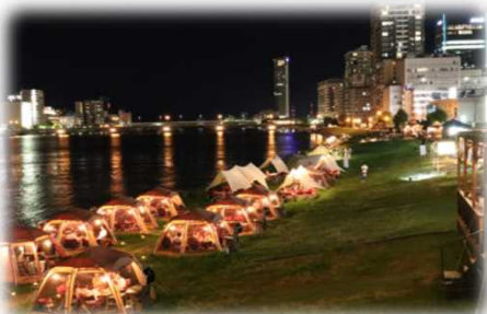
民間事業者の参加 (信濃川 / 新潟市)