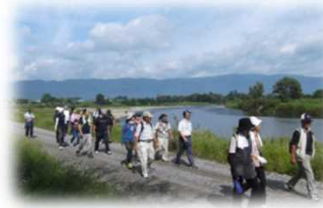
河川管理用通路の利用 (最上川 / 長井市)