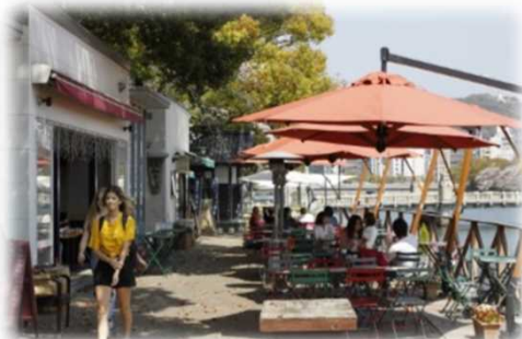
オープンカフェの設置 (京橋川 / 広島市)