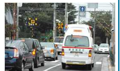
踏切道の長時間遮断による救急救命活動等への支障