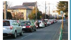
「開かずの踏切」による渋滞