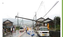
沿道の電柱の倒壊による道路閉塞

② 緊急輸送道路等の沿道区域で、 電柱等の工作物を設置 する場合の 届出・勧告制度 を創設