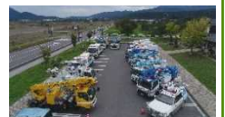
道の駅を拠点として活用した災害応急対策

② 緊急輸送道路等の沿道区域で、 電柱等の工作物を設置 する場合の 届出・勧告制度 を創設