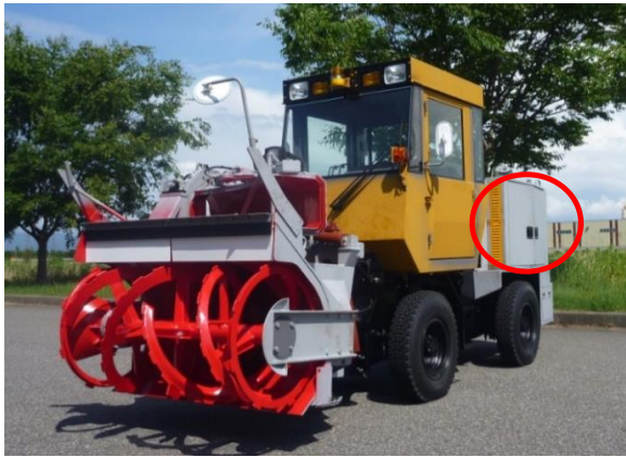
「ニイガタNR83ロータリ除雪車」