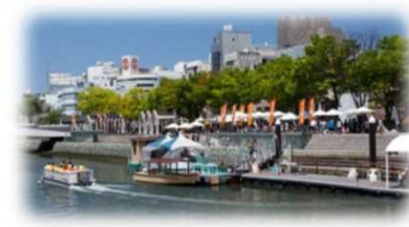
親水護岸の利用 (新町川／徳島市)