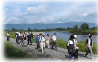
河川管理用通路の利用 (最上川／長野市)