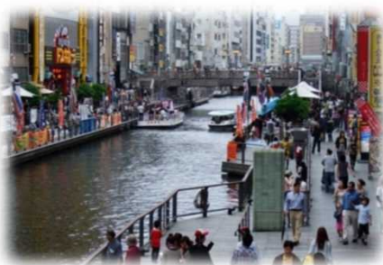
遊歩道の民間活用 (道頓堀川／大阪市)